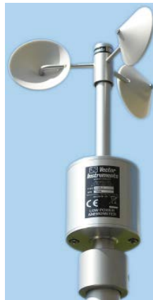
Figura 1- Anemómetro utilizado en la intercomparación